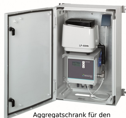
Aggregatschrank für den Innen- und Außenbereich