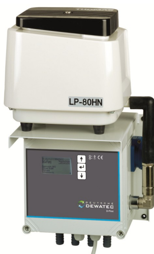
Aggregatkonsole für den wettergeschützten Innenbereich

Wetterfester Schaltschrank für den Einsatz im Außenbereich